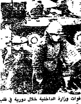
تتحرك سكان باكو اسلحة

كافة تأس السوفييتية ان انباء التي تصل الى المدينة انخفضت بنسبة الثلثين. وتسيطر المعارك في المناطق المتاخمة لغاغوريين كاراباخ وبخاصة شمالي المنطقة التي تتمتع بحكم ذاتي. وابتدت مساعي ارمينية قومية تم الاتصال بها في بريان اسبوعا اسبوعا من ان تقوم الجيش بجلاء سكان غوغاتش شمال غاغوري كاراباخ بينما اعطى مثل قومي في باكو اسم انه تم اجلاء السكان الازربيجانيين في 11 قرية بمنطقة كويالي تقع بين كاراباخ وارمينيا بسبب اطلاق النار المتواصل من جانب الارمن. وفي ناغورني كاراباخ وقع اعتداء ادى الى تدمير خزائن المياه الذي يغذي سبيلتاكبيرت اكبر مدن المنطقة ونذرت